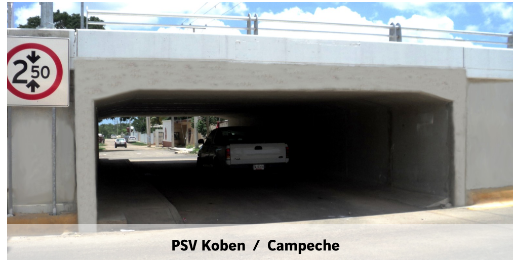
PSV Koben / Campeche

Son ideales cuando se tiene limitante en espacios verticales y horizontales maximizando así el área hidráulica o gálibos necesarios.