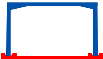
SECCIÓN LOSA FONDO