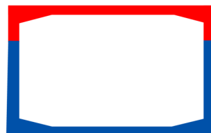
SECCIÓN LOSA TAPA

Sistema de dovelas de sección rectangular que integra muros y losas en una misma sección monolítica (salvo casos especiales).